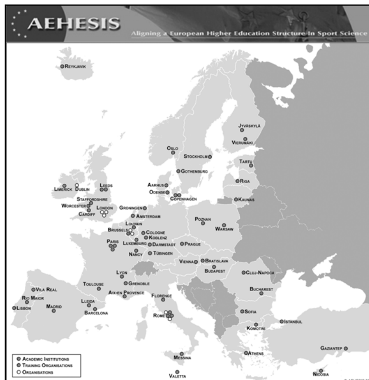
Abbildung 1: AEHESIS Partnerorganisationen

Das Projekt wurde durch das Institut für Europäische Sportentwicklung & Freizeitforschung der Deutschen Sporthochschule Köln, im Auftrag des Europäischen Netzwerks für Sportwissenschaft, Erziehung & Beschäftigung (ENSSEE), koordiniert. In die Leitung des Projekts waren eine Managementgruppe, eine Expertengruppe sowie vier Forschungsgruppen, aus den bereits erwähnten Bereichen der Sportwissenschaft, eingebunden.